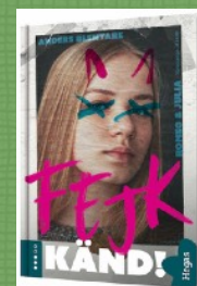
KÄND! - serien